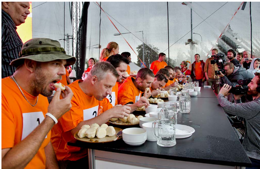
Velkému zájmu publika se každoročně těší soutěž v požívání meruňkových knedlíků